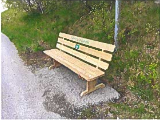
Skravlebank i Hauglia.

I tillegg har vi kunne investert i 12 "skravlebenker" som er plassert ut på ulike lokasjoner i kommune. Forskning viser at en benk (sammen med toalett) er helt avgjørende for at folk, og da spesielt eldre går tur.