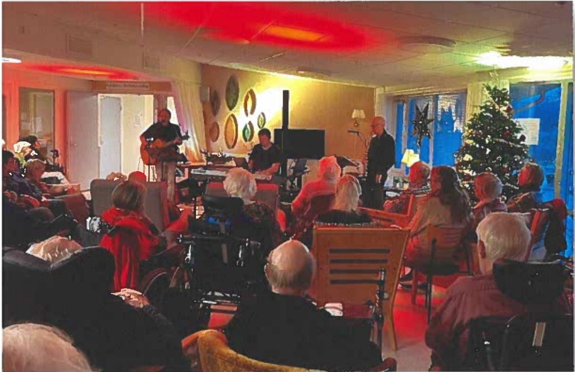
Konsert på Fræna sjukeheim og omsorgssenter i desember.