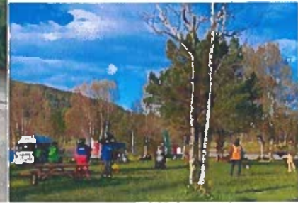
Familiedag på Langvannet