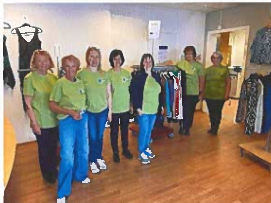
Frivillige i forbindelse med Klesbyttedagen.

Vi hadde markering av frivillighetens dag, 5. desember og serverte kaffe og kaker. I løpet 2026 skal vi arrangere en samling hvor vi går ut bredt og inviterer frivilliges til en sammenkomst som gjennom året har bidratt med innsats gjennom Frivilligsentralen, men i tillegg ønsker vi for første gang å invitere alle som bidrar med frivillig arbeid i kommunen.