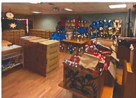
Matkasser og gaveposer pakket ferdig.