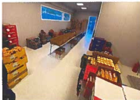
"Matkassesentral" i lånte lokaler til EOIL.